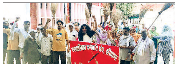
फतेहाबाद। मांगों को लेकर प्रदर्शन करते नगर परिषद कर्मचारी।

हरियाणा सरकार की बेरुखी और लंबित मांगों को पूरा न किए जाने से नाराज नगर पालिका कर्मचारी संघ के आह्वान पर सफाई कर्मचारियों का आंदोलन लगातार तेज होता जा रहा है। इसी कड़ई में शनिवार को लगातार दूसरे दिन भी सैकड़ों की संख्या में कर्मचारी सड़कों पर उतरे और हाथों में उल्टी झाड़ू लेकर शहर भर में जोरदार प्रदर्शन किया। कर्मचारियों ने सरकार की नीतियों