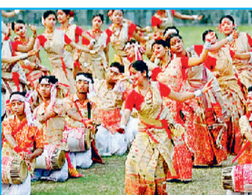
असम का लोकनृत्य-बिहू

आर्थिक दृष्टि से भी है महत्वपूर्ण: इस उत्सव का स्थानीय अर्थव्यवस्था के साथ भी एक बेहद गहरा और सकारात्मक रिश्ता है। उत्सव के दौरान अलग-अलग नृत्य कलाओं के महत्व को रेखांकित करने के उद्देश्य से प्रत्येक वर्ष 29 अप्रैल को अंतरराष्ट्रीय नृत्य दिवस मनाया जाता है। इस अवसर पर भारत की सांस्कृतिक विविधता को प्रदर्शित करते विभिन्न प्रदेशों के प्रमुख लोकनृत्यों के बारे में जानिए।