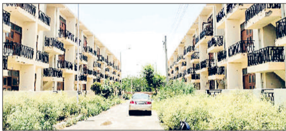
फतेहाबाद। हाउसिंग बोर्ड द्वारा बनाए गए फ्लैट।

हिसार रोड पर सैक्टर 8 के बिलकुल पीछे हाउसिंग बोर्ड द्वारा एक दशक पहले बनाए गए फ्लैटों का आकार छोटा होने के कारण इसे कोई भी लेने को तैयार नहीं। लंबे समय से रख-रखाव के अभाव में ये फ्लैटों का आकार छोटा होने के कारण कोई खरीदने से मात्र 4 फ्लैटों में ही लोग रह रहे हैं। शुरू में यह फ्लैट बीपीएल के लिए बनाए गए थे लेकिन जरूरतमंदों द्वारा इन्हें लेने में कोई रुचि न दिखाने पर हाउसिंग बोर्ड ने इन्हें ई-नीलामी के द्वारा बेचने के काफी प्रयास किए लेकिन एक भी खरीदार नहीं आया। हालांकि शुरू में इसकी कीमत करीब साढ़े 5 लाख रुपये बताई गई थी। फ्लैट्स के यह दाम उस समय के है जब यहां प्रति गज