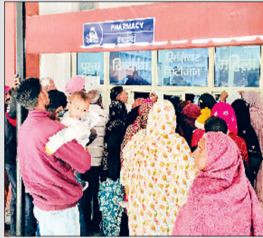
फतेहाबाद। नागरिक अस्पताल में उमड़ी मरीजों की भीड़ व स्कूल में पढ़ाई करते बच्चे।

मौसम विभाग के मुताबिक इस हफ्ते गर्मी से राहत नहीं मिलेगी और पारा 42 के आसपास ही रहेगा। हालांकि अगले हफ्ते एक कमजोर पश्चिमी विक्षोभ सक्रिय हो सकता है, जिससे तेज हवाएं, आंधी और बादल छाने की संभावना है। इससे तापमान में हल्की गिरावट आ सकती है, लेकिन यह राहत ज्यादा दिन टिकने वाली नहीं, इसके बाद फिर हॉटवेव का दौर लौट सकता है।