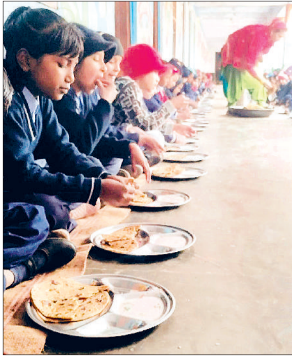
फतेहाबाद। स्कूल में मिड डे मील का भोजन करते विद्यार्थी।

प्रदेश सरकार की महत्वाकांक्षी मिड-डे मील योजना जिला फतेहाबाद में शिक्षा विभाग की कथित लापरवाही के चलते दम तोड़ती नजर आ रही है। जिले के सरकारी स्कूलों में पिछले तीन महीनों से न तो राशन की सप्लाई हुई है और न ही भोजन पकाने के लिए बजट जारी किया गया है। हालात यह है कि शिक्षक अपनी जेब से पैसा खर्च कर बच्चों का पेट भरने को मजबूर हैं। अधिकारी स्कूलों को स्वयं राशन खरीदने की बात कर रहे हैं लेकिन अध्यक्षों का कहना है कि उन्हें इस बारे कोई पत्र नहीं मिला है। ऐसे में सबसे ज्यादा परेशानी शिक्षकों के साथ-साथ भूषण गर्मी में स्कूल आने वाले बच्चों को भी उठानी पड़ रही है।