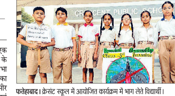
फतेहाबाद। क्रेसेंट स्कूल में आयोजित कार्यक्रम में भाग लेते विद्यार्थी।