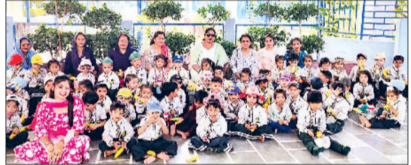
शैक्षणिक भ्रमण के दौरान मस्ती करते हुए विद्यार्थी।

सेठ सागरमल सुराणा जैन कन्या वरिष्ठ माध्यमिक विद्यालय की नर्सरी कक्षा के विद्यार्थियों ने शनिवार को तारा बाबा कुटिया में शैक्षणिक भ्रमण किया। कार्यक्रम की शुरुआत बाबा तारा का आशीर्वाद के साथ हुई। इसके पश्चात बच्चों ने कुटिया में स्थित गुफा का भ्रमण किया। पार्क में खिले रंग-बिरंगे फूलों और उड़ती तितलियों को देखकर बच्चे बेहद उत्साहित नजर आए। भ्रमण के दौरान बच्चों ने अपने साथियों के साथ सैंडविच, चॉकलेट,