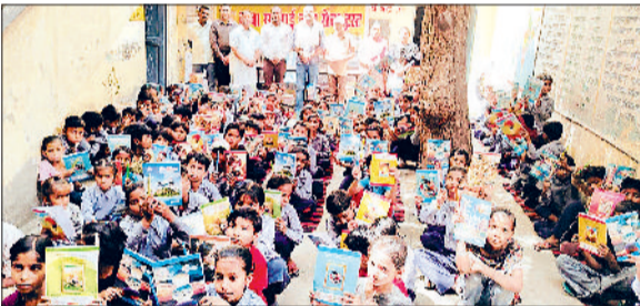
सिरसा। विद्यार्थियों को किताबें वितरित करते हुए।