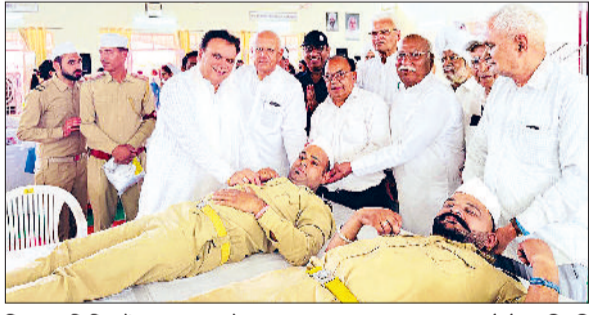
सिरसा। शिविर में रक्तदान करते हुए श्रद्धालु।

■ बाबा गुरबचन के दिखाए मार्गों को व्यवहार में लाना जरूरी