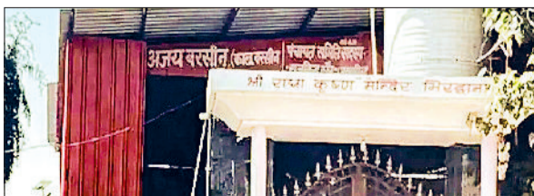
फतेहाबाद। गांव भिरडाना के राधाकृष्ण मंदिर में पंचायत समिति द्वारा बनाया गया शोड।

फतेहाबाद पंचायत समिति की बीजेपी चेयरपर्सन पर सार्वजनिक धन के कथित दुरुपयोग को लेकर बड़ा विवाद खड़ा हो गया है। चेयरपर्सन के खिलाफ मुख्यमंत्री को शिकायत भेजी गई है। शिकायत में आरोप लगाया गया है कि पंचायत समिति/ब्लॉक डेवलपमेंट फंड और डी-प्लान फंड का इस्तेमाल गांवों में मंदिरों व गुरुद्वारों पर आयन शोड बनाने के लिए किया गया। इसे नियमों के खिलाफ बताते हुए