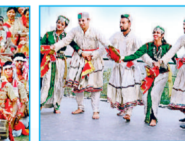
हिमाचल प्रदेश का लोकनृत्य-नाटी

एडथुआ पेरुनल उत्सव की प्रमुख विशेषताएं ▶ यह अलपुझा (केरल) के एडथुआ गांव में मनाया जाता है और इसका मुख्य स्थल सेंट जॉर्ज फॉरेन चर्च है। ▶ यह हर साल 10 दिनों तक अप्रैल के अंत और मई की शुरुआत में मनाया जाता है। ▶ सेंट जॉर्ज को समर्पित इस सांस्कृतिक उत्सव की सबसे खास विशेषता है, इसका भव्य धार्मिक जुलूस। इस जुलूस में सजे-धजे हाथियों की परेड देखने को मिलती है, साथ ही इस दौरान पारंपरिक संगीत और नृत्य की छटा बिखरती है तथा आतिशबाजी का भी खूब रंग-बिरंगा उत्सव देखने को मिलता है। ▶ इसमें विभिन्न धर्मों की आगोदारी होती है, इसमें हिस्सा लेने वाले लोगों का एक बड़ा तबका ऐसे आस्थावान लोगों का होता है, जो अपनी असाध्य बीमारियों से मुक्ति पाने की इच्छा से यहां आते हैं और बीमारियों से मुक्ति पाने के लिए मन्त्रों मांगते हैं।